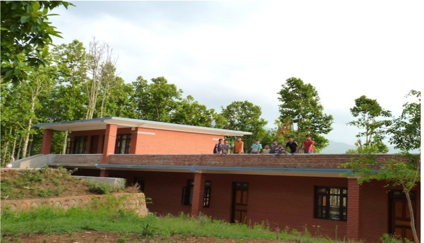
6. Spiel und Spass auf dem Dach unseres Study Center-Gebäudes. Das Dach wurde mit einer Mauer gesichert und den Kindern der unbeaufsichtigte Zugang erlaubt.