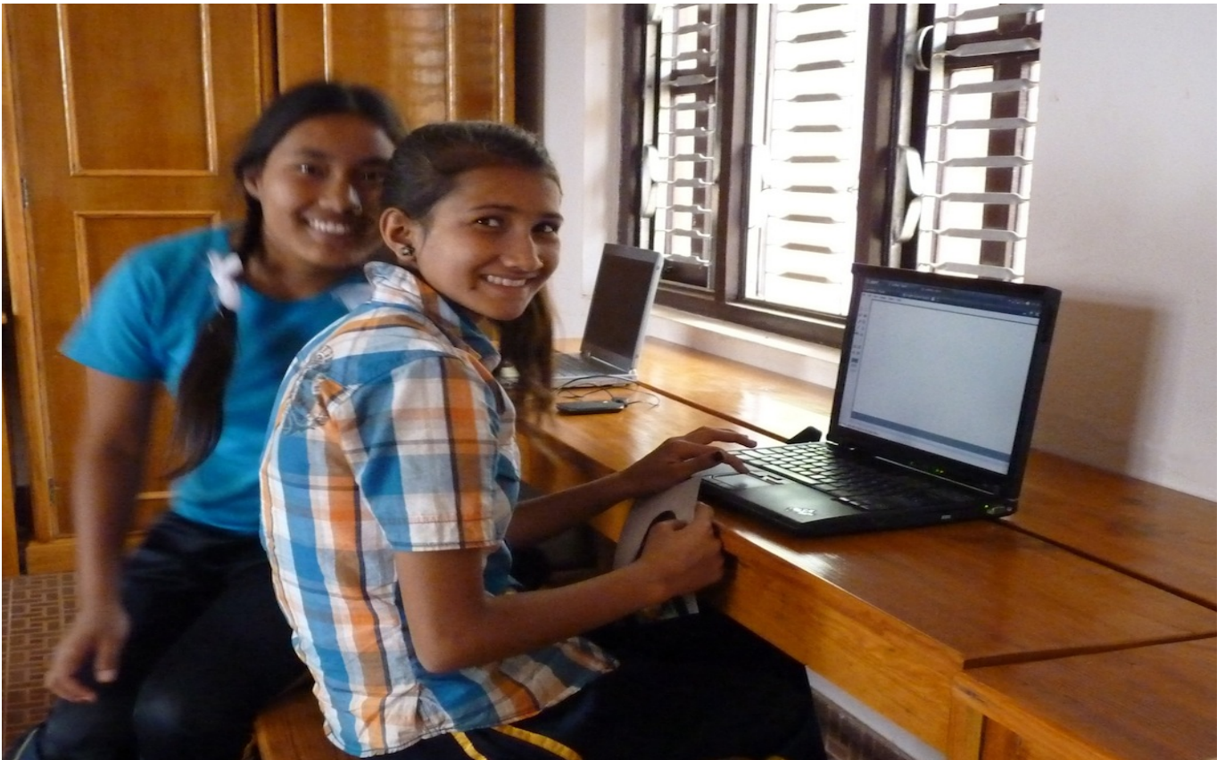
4. Der Sommer-Computerkurs wird derzeit abgehalten und der Lehrstoff den Erfordernissen der Schule angeglichen.