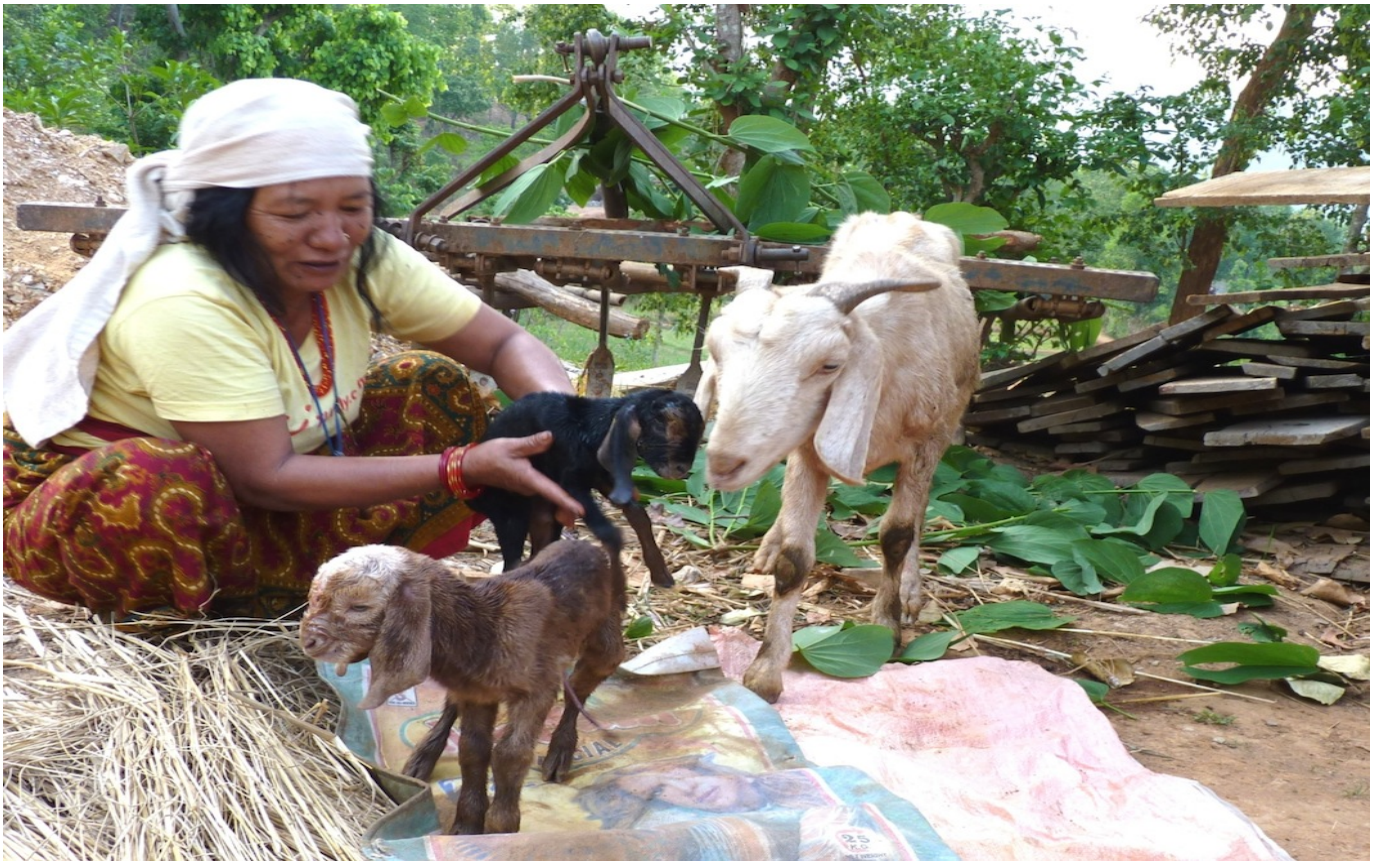
2. Schwarzes Zicklein, wenige Minuten nach der Geburt: Die CFO-Ziegenfamilie wird immer grösser.