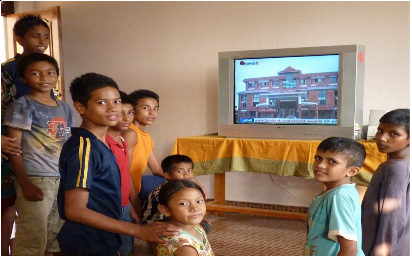
3. Rechtzeitig zur Fussballweltmeisterschaft wurde im Kinderdorf ein Fernsehgerät angeschafft und die Spiele mit grosser Begeisterung verfolgt. Ich soll den CFO-Freunden bestellen: Gratulation Deutschland !