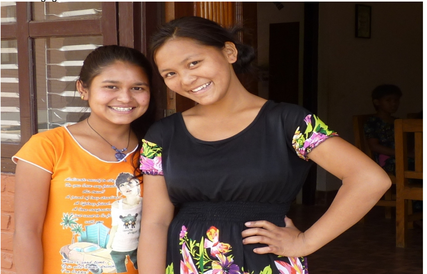
5. Unsere Mädchen im Kinderdorf: Viele CFO-Kinder sind zu Jugendlichen herangewachsen. Vor gar nicht so langer Zeit waren wir ganz mit Kleinkindbetreuung beschäftigt. Jetzt wird Berufsausbildung und Entlassen in die Selbständigkeit immer mehr zum Thema bei CFO.